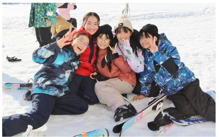
滑り終わってホッとした笑顔!