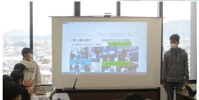
二人とも堂々と発表!