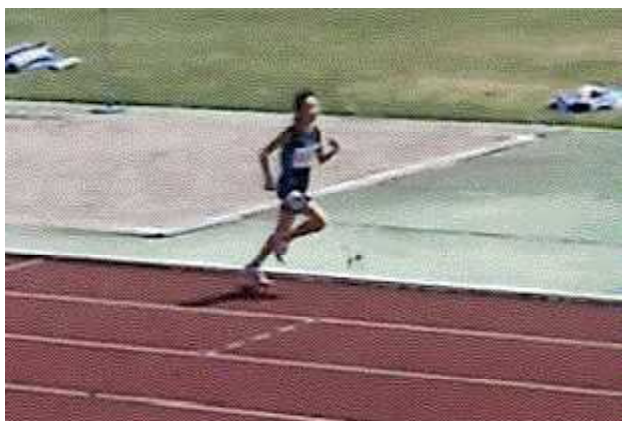
大館北秋田で3位に輝いた○○さんのすばらしい走り!