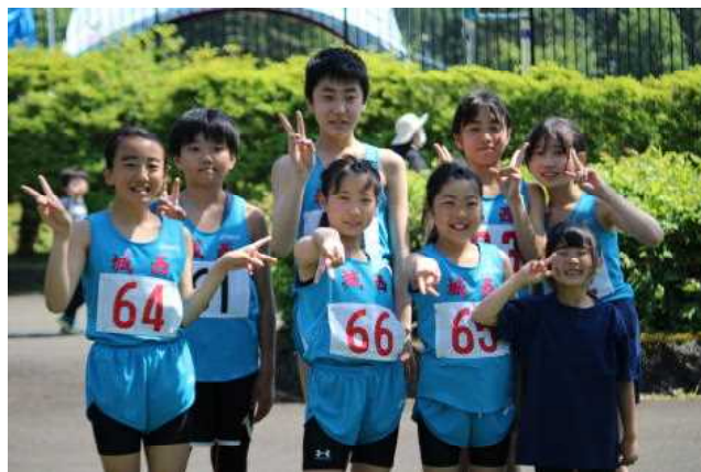
アスリート城西の選手たちの輝く笑顔!