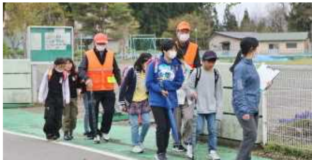
六年生が先頭でリード