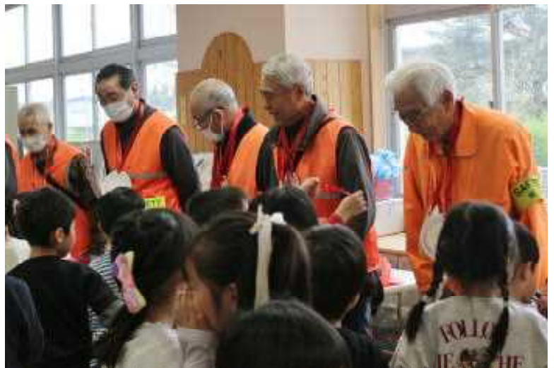
1年生の元気な「校歌」とメダルのプレゼントに微笑むオレンジ隊のみなさん

1年生が一生懸命にがんばる姿や、それを見守る保護者のみなさんの温かい表情、オレンジ隊のみなさんや給食準備に尽力くださった保護者・地域の方々の熱心な取組を目の当たりにし、まさに本校がコミュニティ・スクールとして目指している「チーム城西 ともに光りがやく」を表している一日であったこと、感謝の思いでいっぱいになりました。