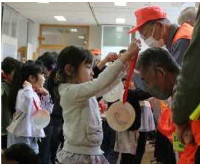
手作りのメダルをプレゼントする1年生たち