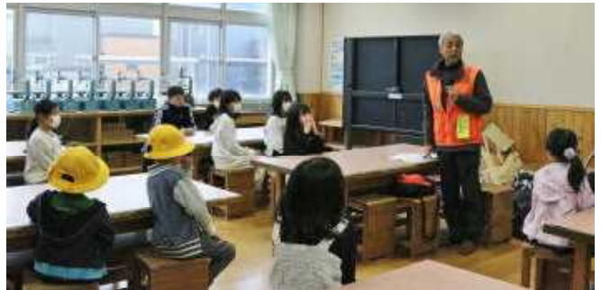
町内連絡会でのお話