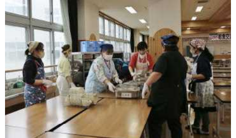
コミュニティ・スクールの説明 オレンジ隊〇〇隊長からのお話 保護者・地域の方々が給食準備中！