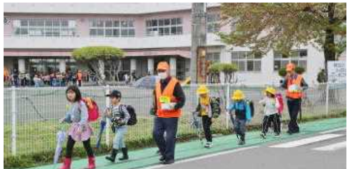
グリーンベルトを通過して